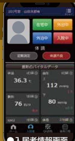
●入居者情報画面 入居者様の様々な情報が即時に確認できます。