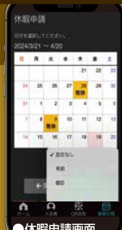
●休暇申請画面 有給申請もスマホから。簡単な操作で申請が完了します。